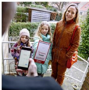
Indsamling, Folkekirkens Nødhjælp